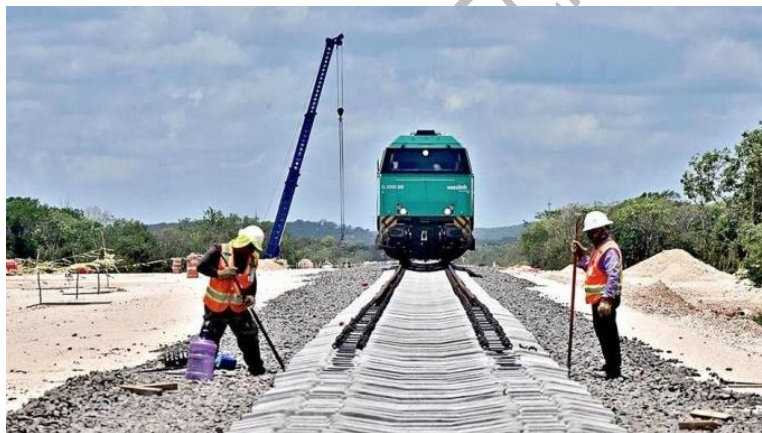
Figura 3. Avance Tren Maya- Tramo 5 Sur