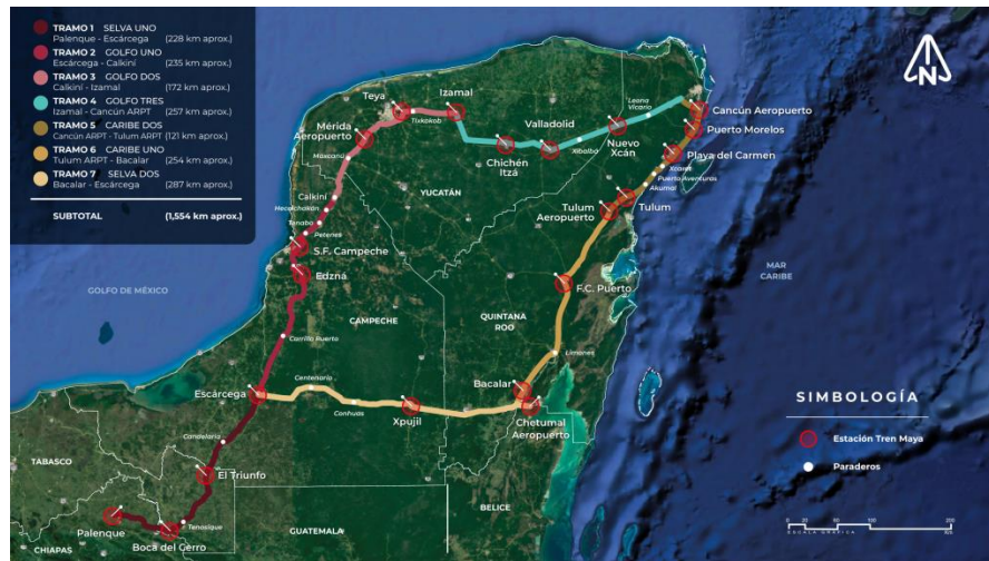
Figura 1. Tramos Tren Maya